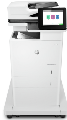
Multifunkční tiskárna HP LaserJet Enterprise M635ft

Tiskárna s dynamickým zabezpečením. Určeno pouze pro použití s kazetami používajícími originální čip HP. Kazety používající jiný čip než HP nemusejí fungovat a ty, které fungují dnes, nemusejí fungovat v budoucnu. Více informací na: http://www.hp.com/go/learnaboutsupplies