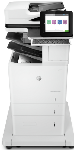
Tiskárna HP LaserJet Enterprise Flow MFP M635z

Tato multifunkční tiskárna HP LaserJet s technologií JetIntelligence spojuje výjimečný výkon a energetickou úspornost s tiskem dokumentů v profesionální kvalitě přesně v době, kdy je potřebujete – a přitom chrání vaši síť před útoky díky nejsilnějšímu zabezpečení od společnosti HP. 1