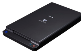
Jednotka plochého skeneru A4 102 (FSU-102)