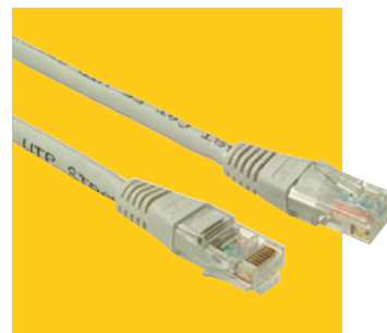
Patch kabel s non-snag-proof ochranou