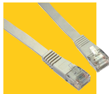
Ploché patch kabely