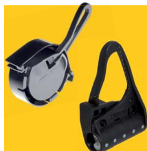
Průběžný závěs pro optický kabel