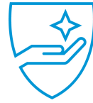
Třiletá záruka s možností vrácení produktu UM933E