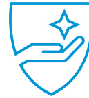
Třiletá záruka s možností vrácení produktu UM933E