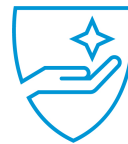
Třiletá záruka s možností vrácení produktu UM933E