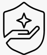
Tříletá záruka s možností vrácení produktu UM908E