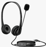
Stereofonní headset HP USB G2 428H5AA